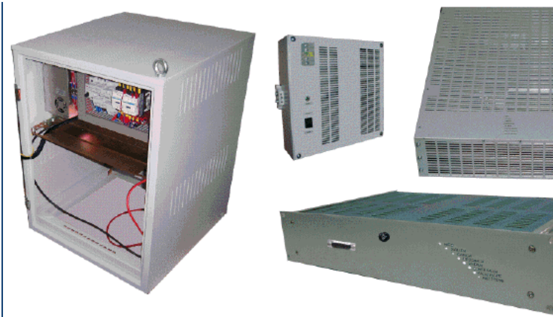
Vista distintas disposiciones en armarios